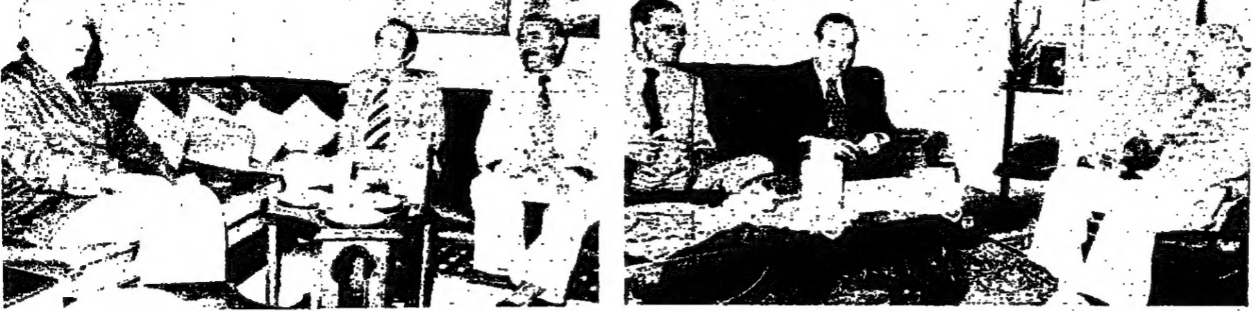
الرئيسان شمعون وهو والشحبي بار الجليل اثناء اجتامعهم بفسطاط